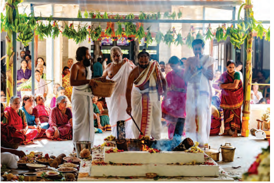
ஸ்ரீ வித்யா ஹோமம்